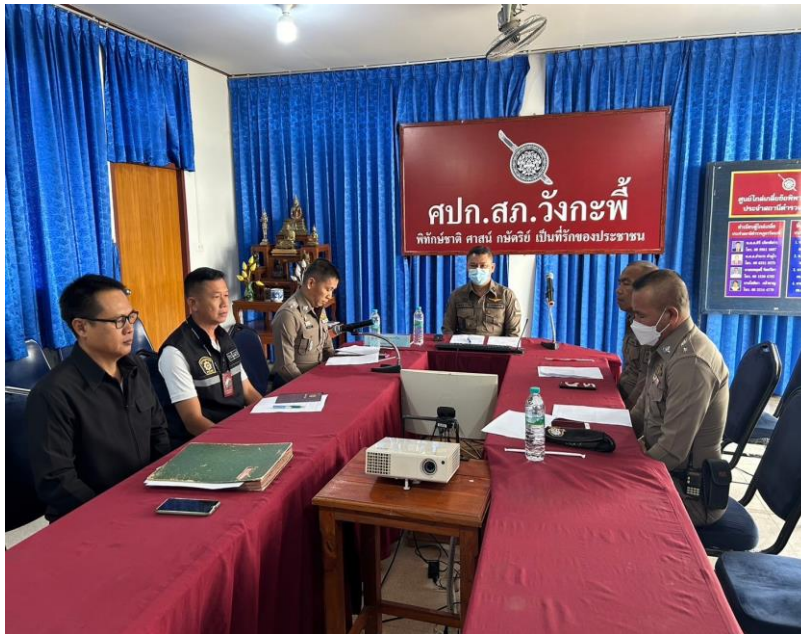
ภาพแสดงคำสั่งแต่งตั้งคณะกรรมการพิจารณาเลื่อนขั้นเลื่อนเงินเดือนของ สภ.วังกะพี้